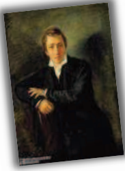
HEINRICH HEINE Ludwig Börne